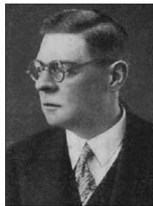
Prameny: Bohemia: 2.6.1916, str. 8 Matrka: L124_9_N_1876-1909_ Potočna_Přichovice str. 68. Nordböhmlische Treuhand G.m.b.H. Relchenberg: Gutachten, 25.4.1921 Relchenberger Zeitung, 14.4.1934 str. 5. Jahrbuch des Deutschen Gebirgsvereines für das Jeschken- und Isergebirge: str. 146, 1934.

Ve volbách do státních zastupitelstev, konaných 2. prosince 1928, byl zvolen do okresního zastupitelstva v Jablonci nad Nis. za německou stranu podnikatelů a 20. června 1929 byl jmenován obchodní a hospodářskou komorou v Liberci rozhodčím soudcem. Umírá 12. dubna 1934 ve věku 54 let. (Pro jeho firmu byla velmi úspěšná prezentace na Světové výstavě v Paříži roku 1937, kde kolekce jeho firmy byla oceněna zlatou medailí, které se už bohužel nedožil.) Pochován je na desenském hřbitově.