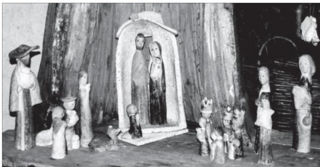
Eva Tesařová: Keramický betlém, 2000

Prameny: Foto: Výstava: Slunce a betlémy v Betlémské kapli, 2016 Foto: Eva Tesařová, Město Jablonec nad Nisou, archiv. Milan Hlaveš: Zprávy, kultura - vydání 25/2004. Text a foto (archiv) Oskar Holata, Tanvald