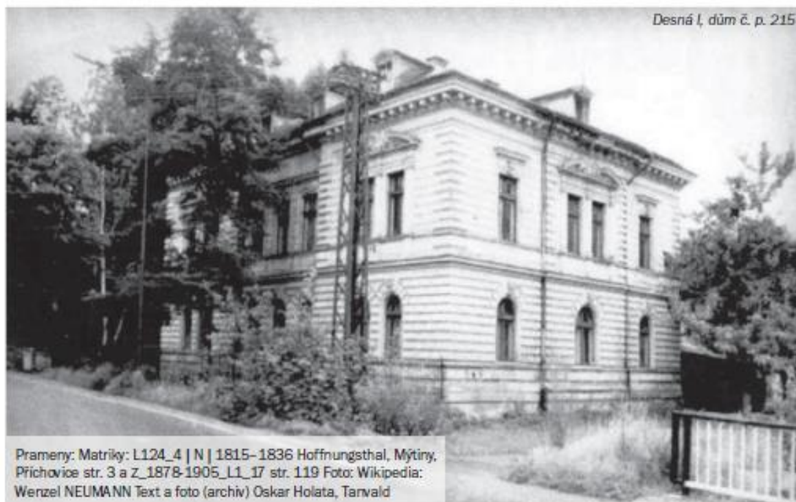
Desná I, dům č. p. 215

1869 vyslal zemský sněm. Opětovně byl delegován v letech 1870 a 1871. Do vídeňského parlamentu se dostal i v přímých volbách roku 1873. Zvolen byl za kurii venkovských obcí obvodu Liberec. Tento mandát obhájil i ve volbách roku 1879. Zde setrval až do své rezignace v listopadu 1880. V zákonodárných sborech podporoval celkový rozvoj regionu a budování železničních sítí a pozemních komunikací. Zemřel 2. února 1885 v Desné (Desná I, č. p. 215) v den svých 69. narozenin na selhání plic. Pochován je na příchovickém hřbitově.