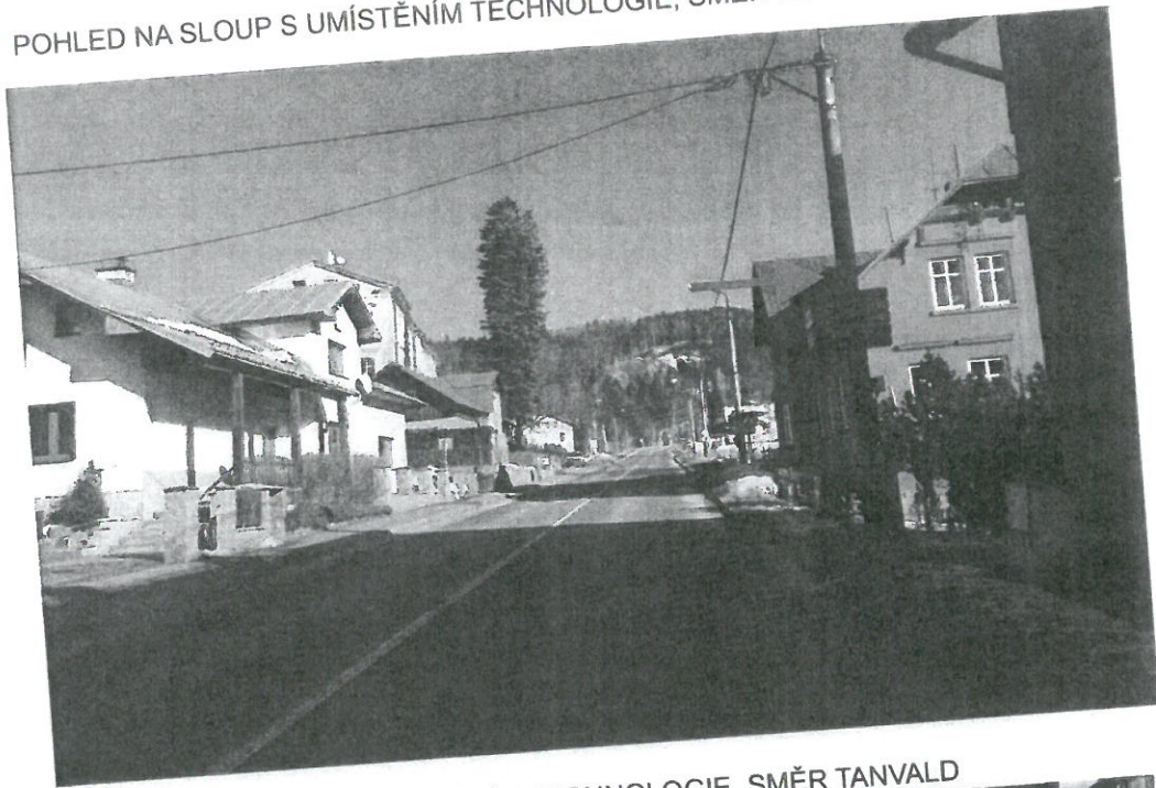
POHLED NA SLOUP S UMÍSTĚNÍM TECHNOLOGIE, SMĚR TANVALD