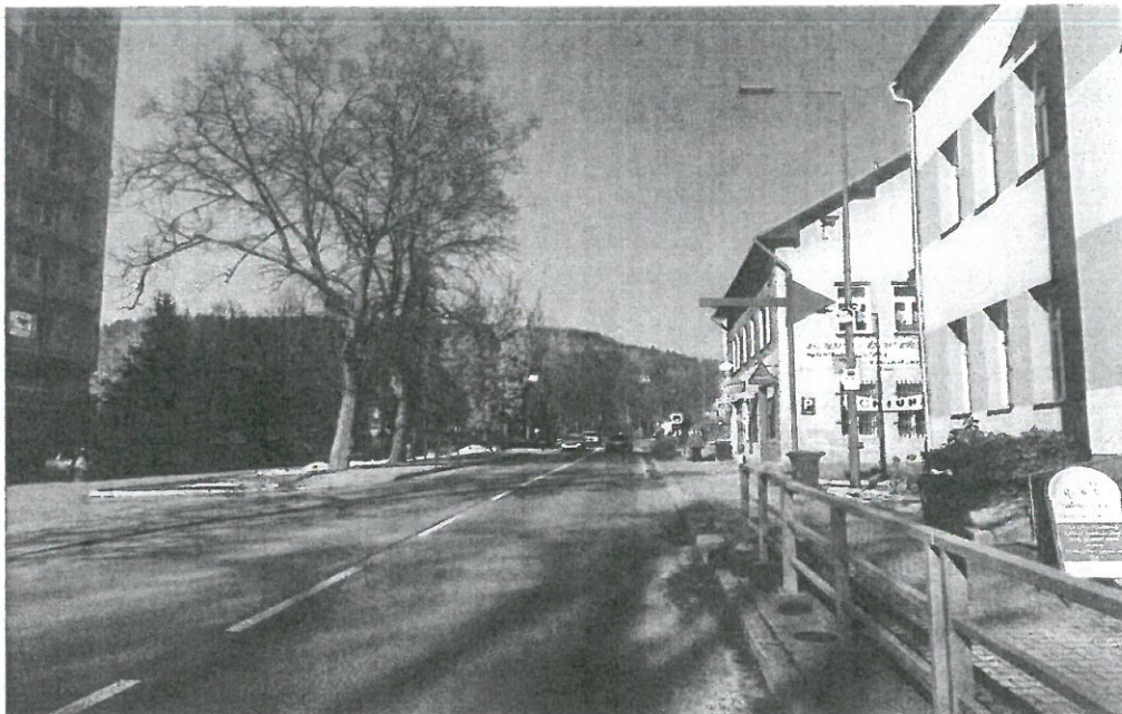
POHLED NA SLOUP S UMÍSTĚNÍM TECHNOLOGIE, SMĚR TANVALD